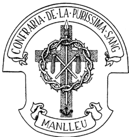
L'escut de la Confraria de la Puríssima Sang i portada de la revista El Record del 1929.

mentats. Aquell any 1928 s'estrena un nou pas "La Coronació d'Espines" del taller de Morell i Teys. Els directors de la revista clamen per la creació d'una confraria que s'encarregués de la organització de la processó del Dijous Sant i també del recapte de diners, amb les aportacions dels socis, per aconseguir millores del vestuari i creació de nou passos. S'adonen que alguna de les confraries actuals, gràcies a les aportacions que fan els seus confreres amb més possibilitats econòmiques que altres, sembla que vulgui fer la competència a les altres en majestuositat i riquesa, objectiu que no vol de cap manera el tarannà religiós dels manlleuencs.