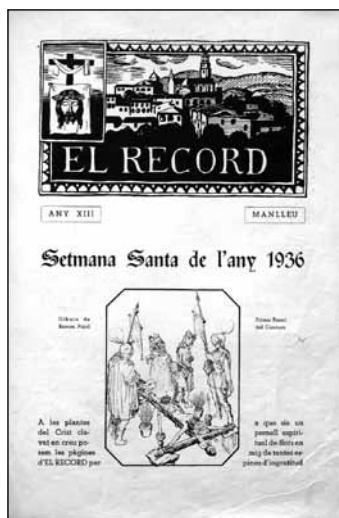
Portada de El Record del 1936.

Cap manlleuenc imagina durant la Quaresma, la imminent persecució clerical que es portaria a terme uns mesos més tard amb la crema de tots els passos de la processó de gran valor artístic, la fatídica nit del 21 de juliol de 1936.