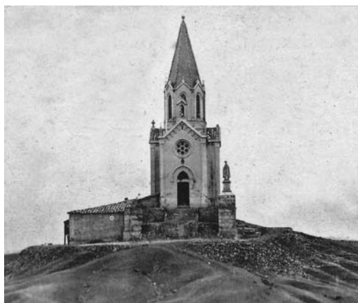
Santuari de Puig-agut (1907).

El 1852 es funda l'Arxiconfraria de les “Filles de Maria” a la vila de Manlleu. Aquesta entitat religiosa agombolava les noies no casades i estava enfocada a viure la vida cristiana sota la protecció i model de la Verge Maria. El seu estendard era blanc i blau. («Hoja Dominical» núm. 1174)