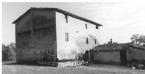
Masia de Vilamuntà.