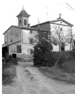
La nova ermita de Sant Jaume.

Però un centenar d'anys més tard, el 1854 , l'ermita s'ha tornat a deteriorar de tal manera que el bisbe Antoni Palau prohibeix la celebració de misses a Sant Jaume Vell pel mal estat de la capella. (Manlleu Arqueològic)