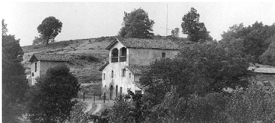
La masia de Sant Jaume Vell i al darrere el turó de l'ermita.